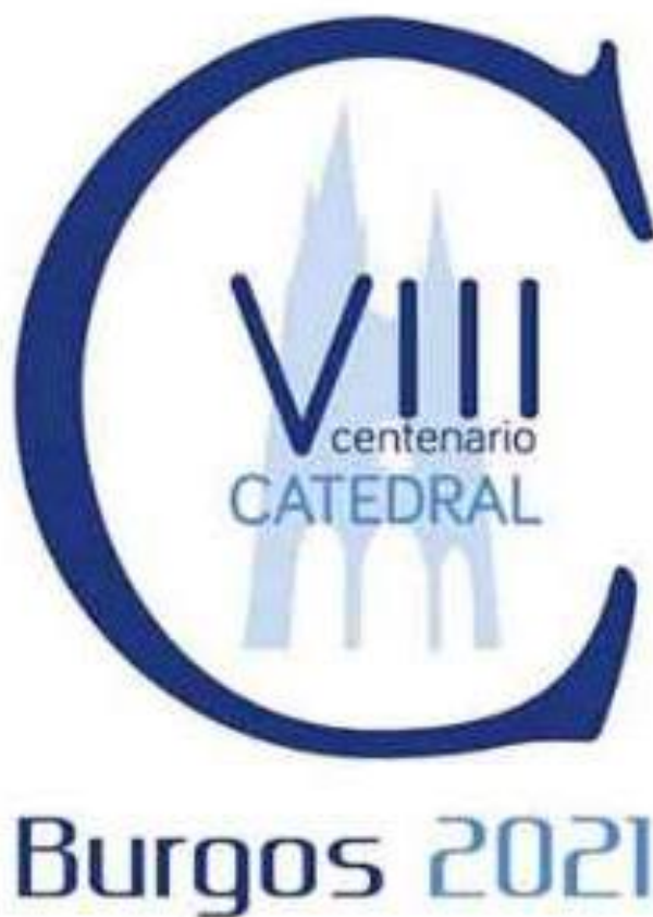
Imagen 1: Logotipo del evento.

A lo largo de todo este año, FUNDACECYL ha seguido comprometida y colaborando con los diferentes eventos y actividades que se han promovido desde las diferentes entidades del tercer sector y que nos hemos unido junto a otras entidades en la Fundación VIII Centenario de la Catedral de Burgos.